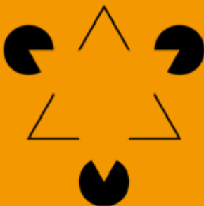
Il triangolo di Kanizsa

Ai partecipanti sarà data in omaggio una stampa botanica tratta dall'Hortus Eystettensis di B. Besler.